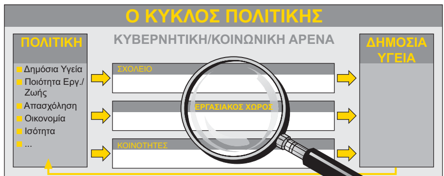
Σχήμα 2: Ο κύκλος πολιτικής σε διάφορους τομείς.