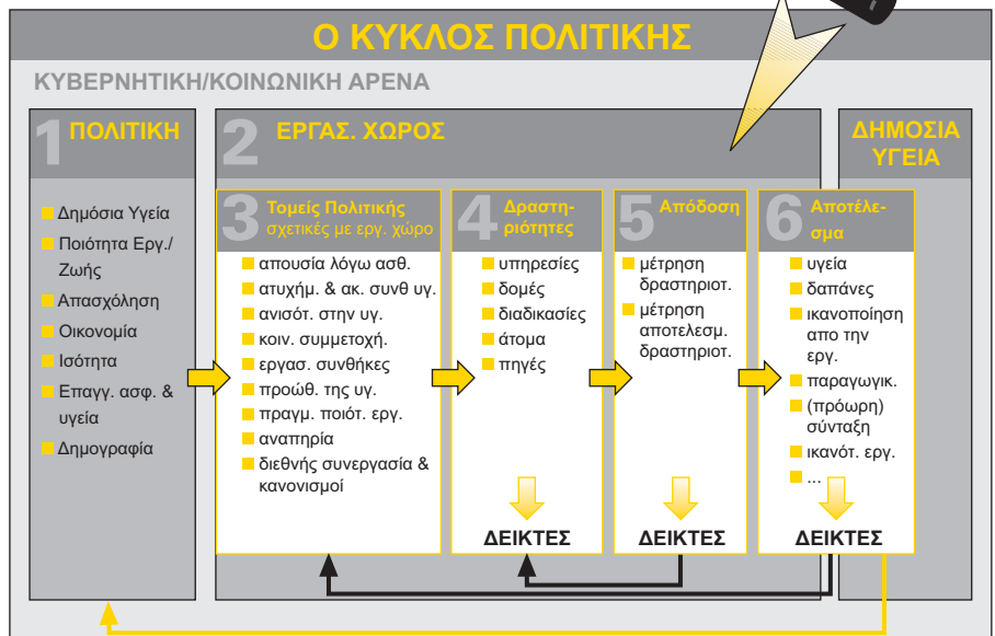
Σχήμα3: Μοντέλο του κύκλου πολιτικής για την παρακολούθηση της υγείας στην εργασία στο πλαίσιο της δημόσιας υγείας. Το παραπάνω μοντέλο απεικονίζει τον τομέα της εργασίας και της υγείας στο πλαίσιο ενός ευρύτερου πολιτικού περιβάλλοντος: Η κυβερνητική/κοινωνική αρένα καθορίζει πολιτικές (1) που καλύπτουν ένα ευρύ φάσμα τομέων (π.χ. τη δημόσια υγεία, την ποιότητα ζωής, την ισότητα, την επαγγελματική ασφάλεια και υγεία κλπ.). Περιλαμβάνουν πολιτικές σχετικές με το χώρο εργασίας (2), όπως "μείωση των ανισοτήτων σε θέματα υγείας", "καλύτερη διαχείριση των απουσιών από την εργασία λόγω ασθένειας" ή "βελτίωση των εργασιακών συνθηκών" (3), οι οποίες έχουν κατά συνέπεια αντίκτυπο στην υγεία του εργατικού δυναμικού. Η συγκεκριμένη διαδικασία μπορεί να ελέγχεται στο πλαίσιο ενός συστήματος ελέγχου της υγείας στην εργασία. Οι δείκτες ενδέχεται να εκφράζουν τις δραστηριότητες (4) που διεξάγονται στο χώρο εργασίας, την απόδοση (5) και το τελικό αποτέλεσμα (6).